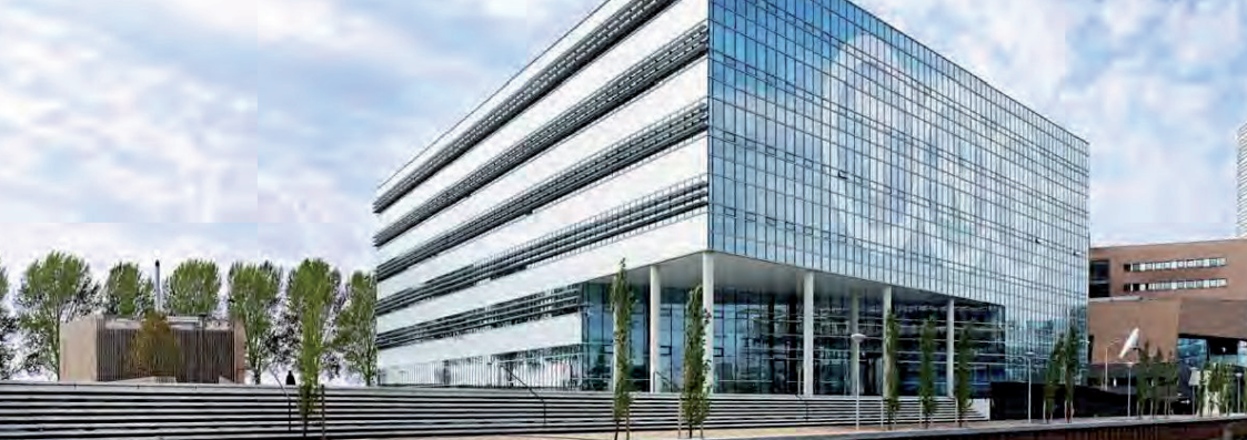
Sustainable TNT Centre, Exterieur